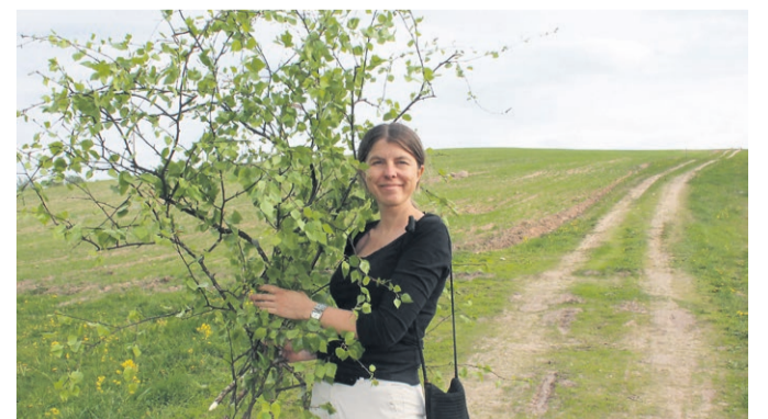
Mõned aastad tagasi suvistepühiks kaseoksi koju viimas. Nelipühi vaimust tahan hoida jalale lambiks Eesti Kirikut tehese.

Tänu olgu Jumalale, kes ei ole heitnud kõrvale mu palvet ega ole mult ära võtnud oma heldust! (Ps 66:20)